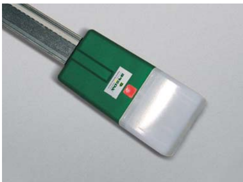
DUO SL 650