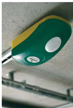
V800E / V800 PLUS